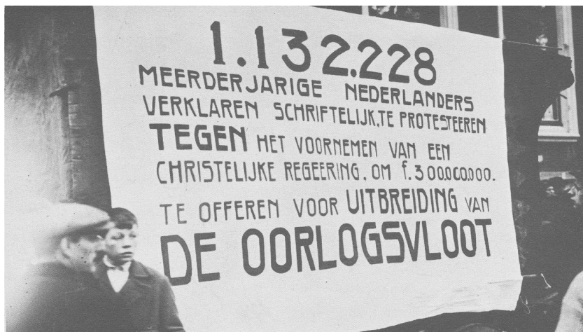
Minister Colijn wil 300-miljoen gulden steken in uitbreiding van de vloot in Oost-Indië. Er komt een handtekeningactie en een grote betoging. De Vlootwet wordt door de Tweede Kamer verworpen.